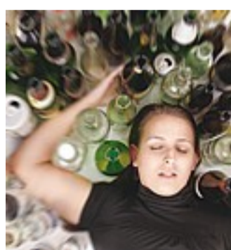
Rischio Giovani, effetto bomba dell'alcol

L'esperto del Sert dopo il caso della diciassettenne in coma etilico: ora la ragazza è fuori pericolo