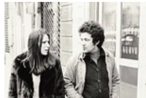
Battisti con la moglie nel 1974