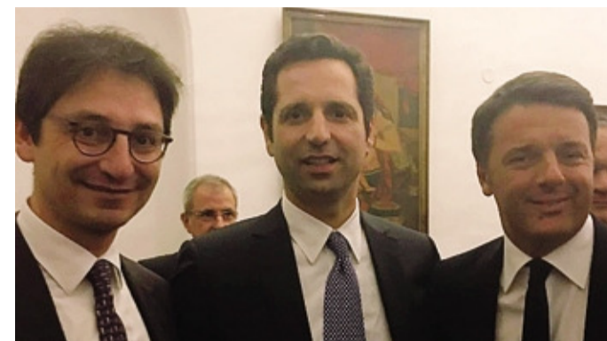
Massimo e Cristian Vitali con Matteo Renzi durante la missione in Iran