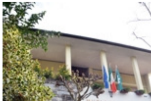
Il municipio di Lierna

360 ore di servizio sociale, più un risarcimento di 8 mila euro. Messa in prova per l'ex vigile di Lierna che fece sparire le multe. A CRIPPA A PAGINA 30