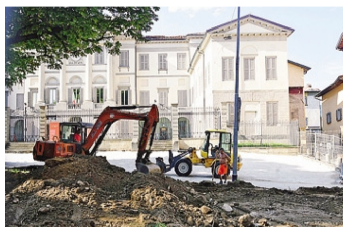
I lavori in piazza Carrara, sullo sfondo la barchessa

Procedono invece a buon ritmo i lavori di rifacimento di piazza Carrara, iniziati nei primi giorni di luglio, appena concluso l'intervento di Uniacque sulle tubature sotto la piazza. Il progetto vincitore del bando prevede il rifacimento della pavimentazione, elemento di continuità tra Accademia Carrara e Gamec, nuovi spazi di aggregazione e il