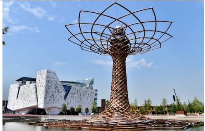
L'Albero della vita e il Padiglione Italia (fotogramma)

Chiuse le offerte per convertire l'ex area di Rho: un'operazione che vale 2 miliardi. In gara sono rimasti gli australiani di Lendlease e i francesi di Stam Europe