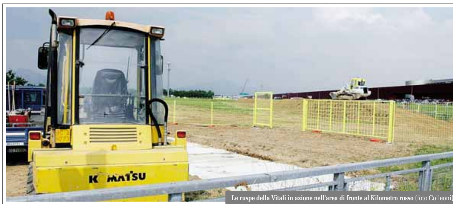
Le ruspe della Vitali in azione nell'area di fronte al Kilometro rosso